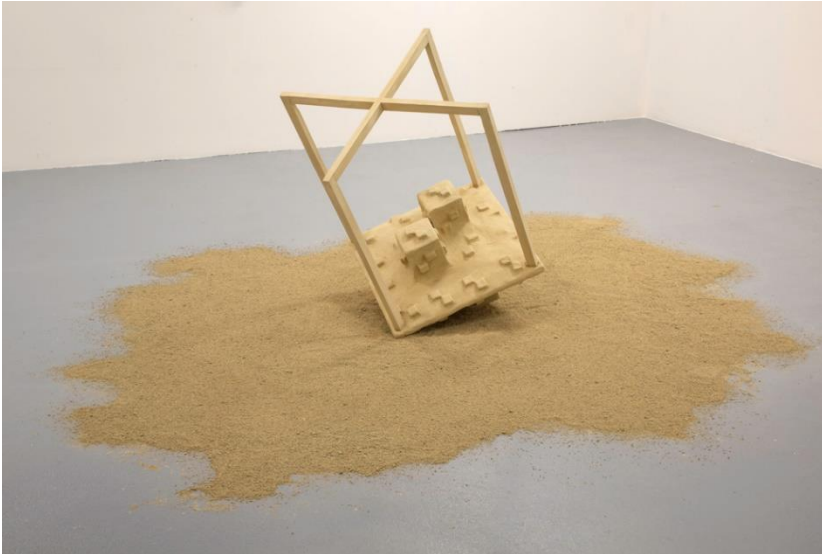
Ce qui fait état d'absence à la surface , Lidia Lelong, 2022. Bois, grillage, lin, terre de Tournon d'Agenais, 310 x 280 x 110 cm. Production : Résidence Pollen, Monflanquin.

Dans le travail de Lidia Lelong, l'exploration des espaces, qu'ils soient liés à l'architecture ou à des recherches prélevées au domaine de la science, est retransmise ici à travers des sculptures porteuses de récits sous-jacents. “Les œuvres de Lidia Lelong éclosent selon un processus analogue. Au gré de ses déplacements, l'artiste observe des formes et des couleurs dans le paysage ou l'architecture, qu'elle garde en mémoire. Elle les interprète ensuite selon les souvenirs qu'elle en conserve, inéluctablement parcellaires, altérés mais aussi colorés par les atmosphères de ces moments révolus. Les couleurs, les dimensions et les fonctions sont donc libérées des formes initiales pour devenir autres” . 3 La coexistence des pièces de chacun·e·s est mise en exergue par une notion commune. Les signes évoqués par les formes et les jeux visuels qu'ils engendrent, renient l'extraordinaire et l'insolite au profit d'un regard personnel sur ce qui nous entoure, d'une “translation” de notre environnement proche.