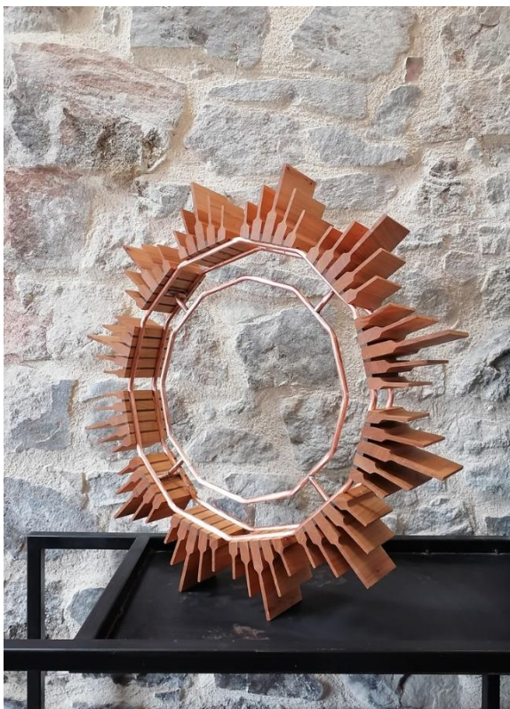
Sans titre, Maxime Thoreau, 2022. Merisier, noyer, cuivre, 65 x 65 x 10 cm.

A l'origine de son travail, Maxime Thoreau puise ses sources dans le panel de formes des machines industrielles. “Partant à chaque fois d'un modèle issu de l'industrie, il en simplifie la forme jusqu'à l'épure. En aucun cas il ne s'agit pour lui de reproduire. Chacune de ses créations apparaît ainsi plus proche de la maquette et donc du concept, que de sa réalisation. La seule reproduction qui l'intéresse est celle de l'émotion que son modèle suscite [...] et l'imagination que l'écart qu'il ménage dans son travail par rapport à ce modèle, amplifie” . 2 Aujourd'hui, Maxime Thoreau s'émancipe des formes existantes pour en extraire une typologie formelle imaginaire toujours proche du mécanisme mais teintée de science-fiction.