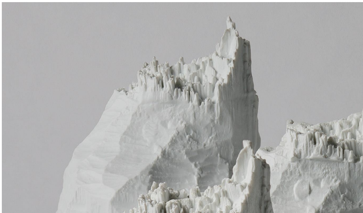
Vincent Carlier, détail Beavers