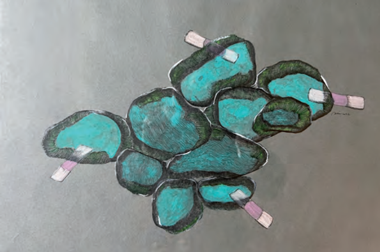
Marjorie Méa Panser-paysage , en cours depuis 2022