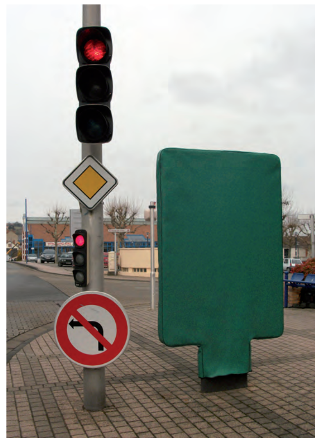
Jean Bonichon Housse à panneaux publicitaires , 2011 skaï doublé vert, joncs et fermeture éclair noirs. 235 x 130 x 93 cm.

LAVITRINE ( lac&s ) invite Jean Bonichon , Aurélien Mauplot et Marjorie Méa 16 mars au 03 mai 2024