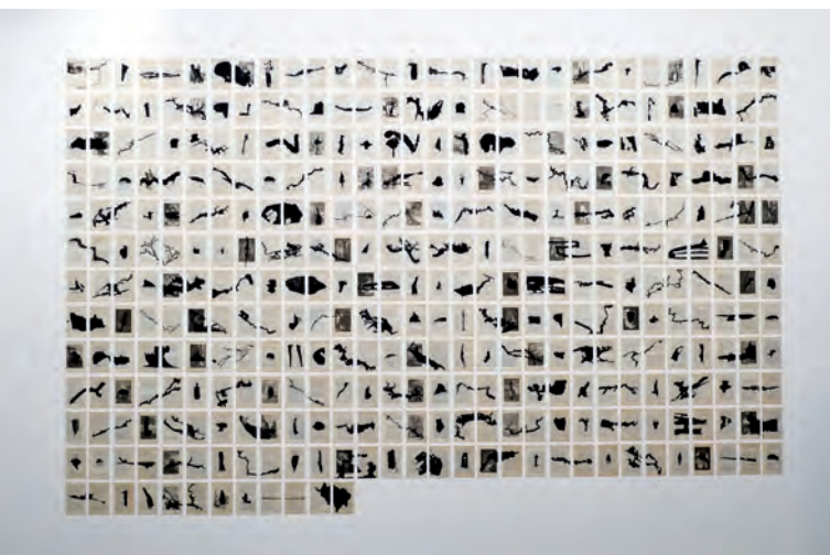
Aurélien Mauplot Les Salons noirs 2021 Impressions numériques sur pages de livre 376 x 238 cm

LAVITRINE ( lac&s ) invite trois artistes du CAC23bis (association Collectif des artistes de la Creuse) et affirme son engagement dans le soutien à la création contemporaine en région. Jean Bonichon, Aurélien Mauplot et Marjorie Méa ont répondu à l'appel et proposent des variations imaginaires autour du paysage.